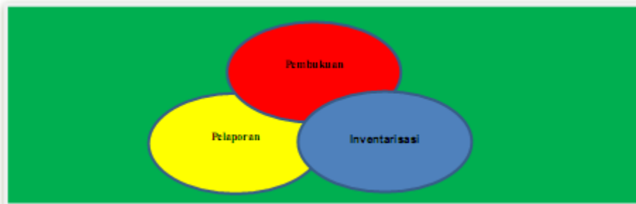
Gambar 1. Proses Penatausahaan Barang Milik Negara

Penatausahaan Barang Milik Negara bertujuan untuk mewujudkan tertib administrasi dan mendukung tertib pengelolaan Barang Milik Negara yang meliputi penatausahaan pada Kuasa Pengguna Barang/Pengguna Barang serta Pengelola Barang sebagaimana diatur dalam Peraturan Menteri Keuangan Nomor: 181/PMK.06/2016 tentang Penatausahaan Barang Milik Negara.